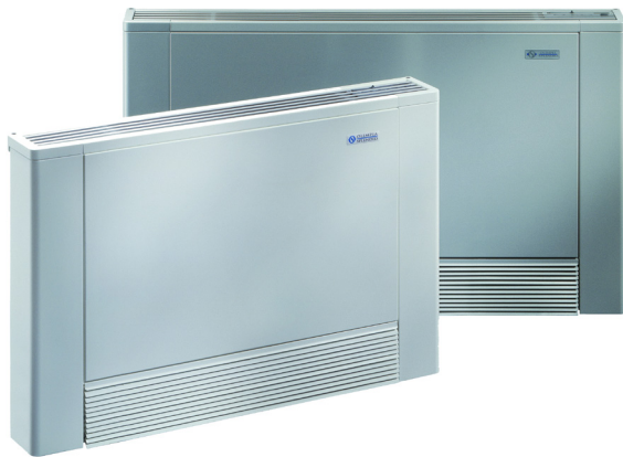
Bi2 - Viftekonvektor

Viftekonvektorene fås i hvit (RAL 9010) eller i sølvfarget utførelse.